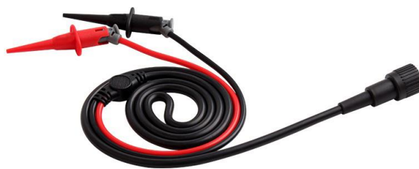
BNC 转测试勾连接线 (CK-311)